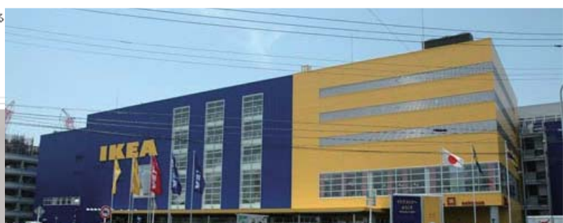
イケアは全世界に 280 店舗を持つ、北欧スウェーデン発の世界最大の家具販売流通会社です。