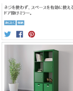
シングルセル・ダブルセル、使いやすい収納。