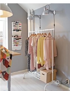
スタイリッシュな洋服スタンドで、ファッションショップのような空間をつくる。

参加連絡： hi-kusubayashi@kyoto-saga.ac.jp に 5 月 1 日 18 時までにメール